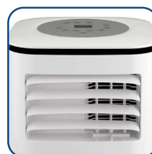
Alette regolabili in senso verticale Vertically adjustable flaps