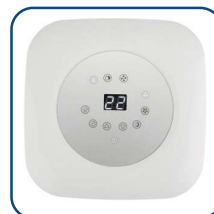
Pannello comandi touch con display a LED Touch control panel with LED display