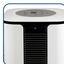
Dettagli di design e pratiche maniglie laterali Design details and useful side handles